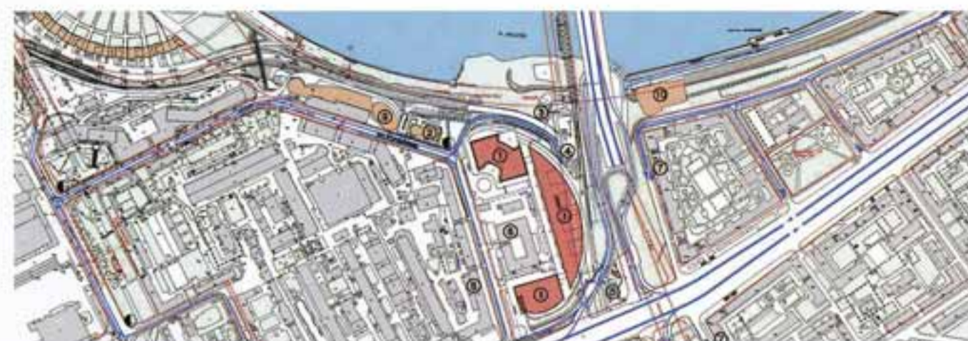
шк II Самый серьезный на сегодня проект мастерской – офисное здание на улице Кульнева. Генплан